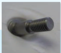
純タングステン 外ネジ M6

制御回路基板設計・実装／ダイカスト品／プレス品／切削加工品 他 単なる材料や部品を売るだけではありません。難削材加工や特殊材料の対応も可能です。