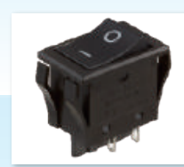
スイッチ、各種回路部品 他

制御回路基板設計・実装／ダイカスト品／プレス品／切削加工品 他 単なる材料や部品を売るだけではありません。難削材加工や特殊材料の対応も可能です。